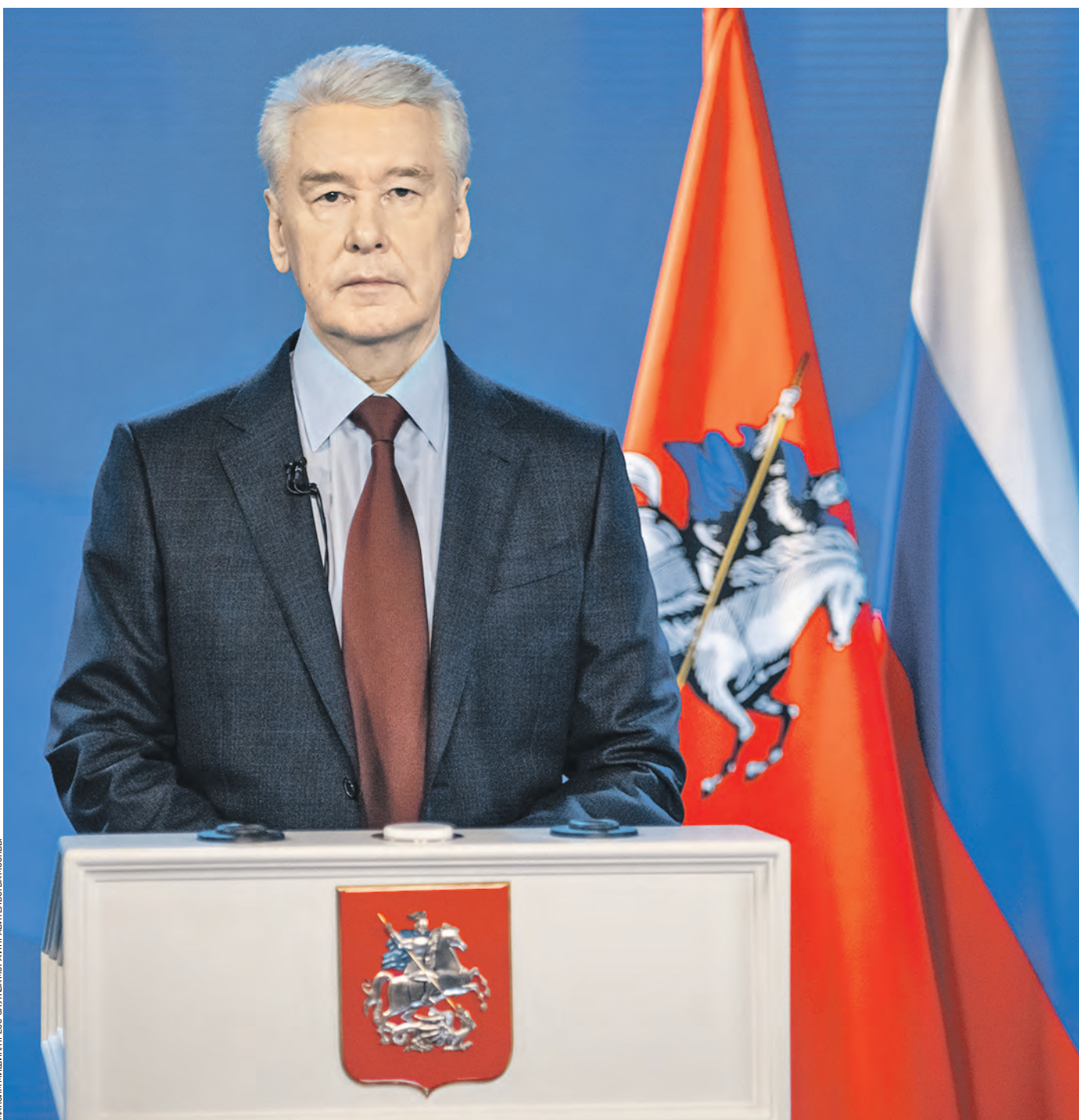
Вчера 13:00 Мэр Москвы Сергей Собянин выступает в Мосгордуме с ежегодным отчетом о деятельности столичного правительства

Пандемия стала жестким экзаменом на прочность и эффективность всей системы управления городом. Уже в конце февраля стало ясно, что жить, как обычно, дальше нельзя. Но в то же время объявлять режим чрезвычайной ситуации, классический карантин — значило полностью отменить права и свободы граждан и полностью обрушить любую обычную жизнь. Режим повышенной готовности, в рамках которого Москва живет уже 10 месяцев, стал тем самым оптимальным путем здравого смысла. С одной стороны, он позволил принимать нужные решения, с другой — мы сохранили нормальную городскую жизнь, насколько это было возможно. Для перехода на новые принципы управле-