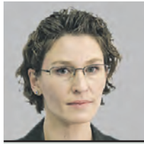
ИРИНА ИРБИТСКАЯ ДИРЕКТОР ЦЕНТРА ГРАДОСТРОИТЕЛЬНЫХ КОМПЕТЕНЦИЙ РАМПС ПРИ ПРЕЗИДЕНТЕ РОССИЙСКОЙ ФЕДЕРАЦИИ